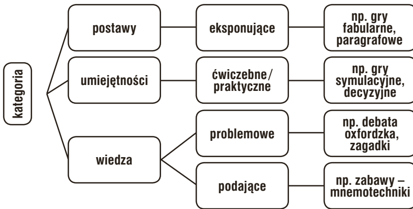
Rysunek 2. Kategorie celów, metody oraz rodzaje gier